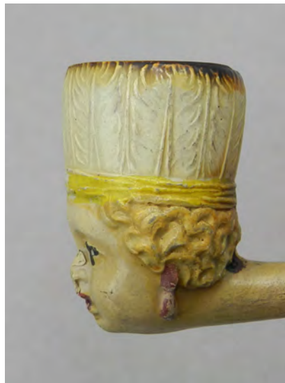
Afb. 4a. Pijp met gezicht van een indiaan met verentooi.