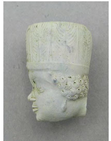
Afb. 4b. Een in geringe mate afwijkend model