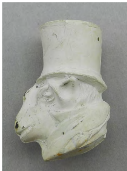
Afb. 3b. Overeenkomstig fragment, bodemvondst Gouda.