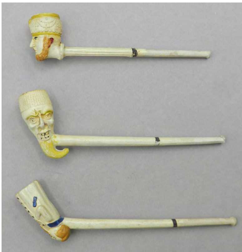
Afb. 1a-b. De groep 19e eeuwse pijpen waarvan de toeschrijving onduidelijk is. De pijpen links hebben een schuin afgesneden mondstuk terwijl die van de pijpen rechts rond zijn.