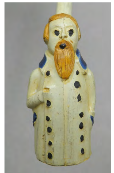
Afb. 7. Pijp met een omgekeerd afgebeelde man met baard in een lange jas.