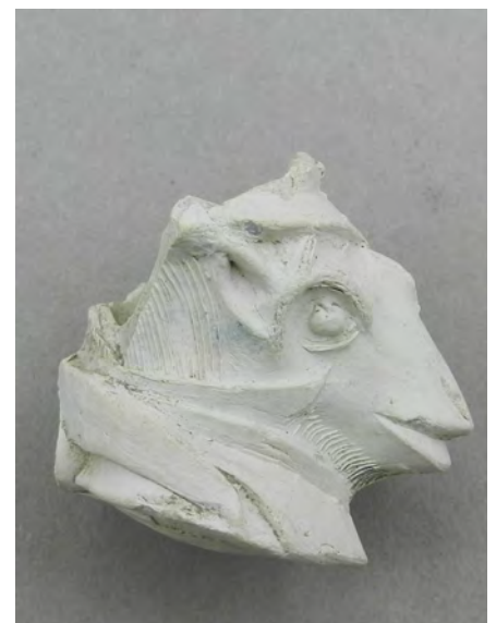
Afb. 3c. Afwijkend fragment, bodemvondst Gouda.