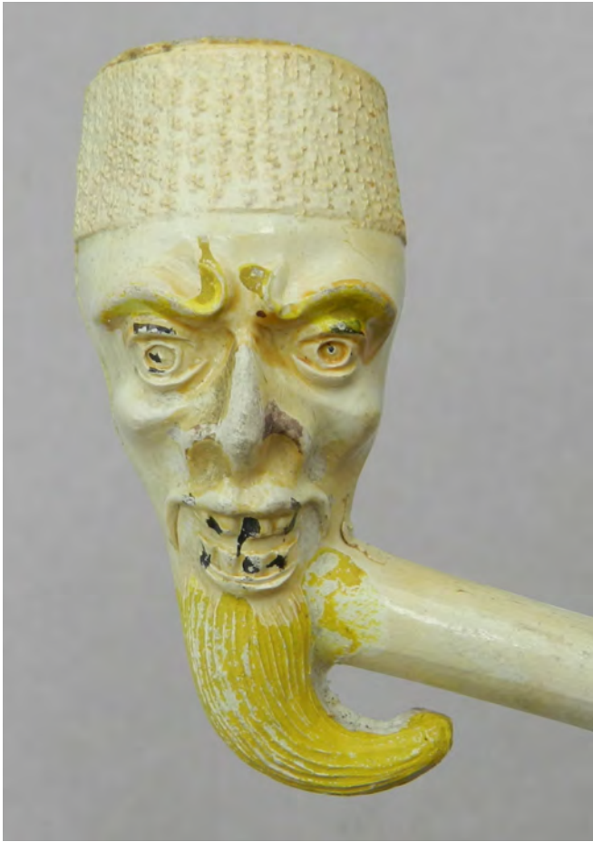
Afb. 2. De faun/duivel pijp.

mallen. De manier waarop de koppen uitgebeeld zijn maakt echter ook duidelijk dat de mallen niet in Nederland vervaardigd zijn. Immers Nederland kende, in tegenstelling tot België en Frankrijk geen beeldhouwkundige traditie in de 19e eeuw. Helaas zijn deze modellen niet uit België bekend, wat betekent dat een herkomst uit de Maastreek niet kan worden bevestigd.