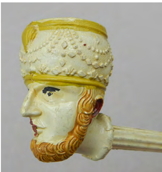
Afb. 6. Pijp met een man met een tulband en een baard.