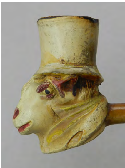
Afb. 3a. Pijp met de kop van een bok.

De pijp met de Phrygische muts is een pijp die met name voor de Franse markt geschikt was. De pijp was een zinnebeeld voor Frankrijk en de vrijheid. In Nederland zal een dergelijke pijp weinig verkocht zijn. 6