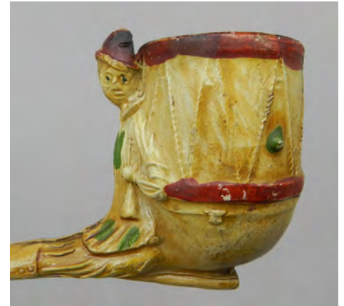
Afb. 8a-b. Een pijp van P.J. van der Want met een rode band om de steel.